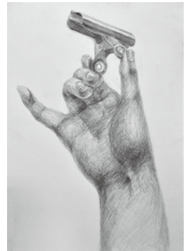
筑波大学 合格者 作品