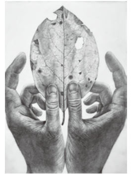
多摩美術大学 合格者 作品

申込期間 授業料納入期限 12/12迄 * 12/17~22 は休みの為、見学及び受講申し込み不可